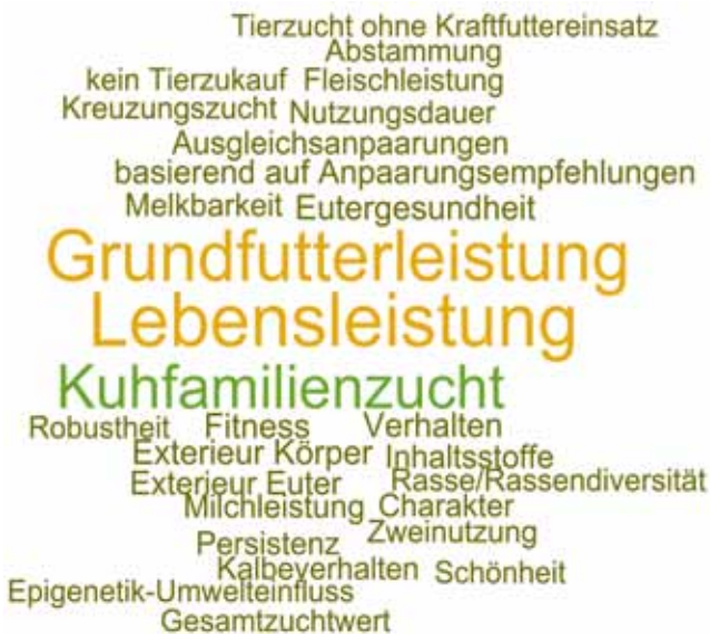
Abb.2 Genannte einzelbetriebliche Zuchtstrategien und Selektionsziele dargestellt als Wortwolke. Die Schriftgröße ist proportional zur Anzahl der Nennungen eines Kriteriums.

Immerhin 21 befragte Betriebe setzen nur Bullen aus eigener Nachzucht ein und züchten so komplett