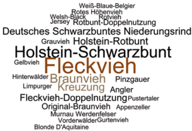
Abb.1 Rassespektrum auf Demeter-Betrieben als Wortwolke. Die Schriftgröße ist proportional zum relativen Anteil der jeweiligen Rasse an der Gesamtpopulation.

zu oder kombinieren die KB mit dem Bullenzukauf. Auch hier ergeben sich potenzielle Abhängigkeiten, insbesondere, wenn Bullen nicht von Demeter-Betrieben, sondern von konventionellen oder ökologischen Betrieben zugekauft werden. Langfristig könnten hier ähnliche Probleme wie beim abschließlichen Einsatz der künstlichen Besamung entstehen.