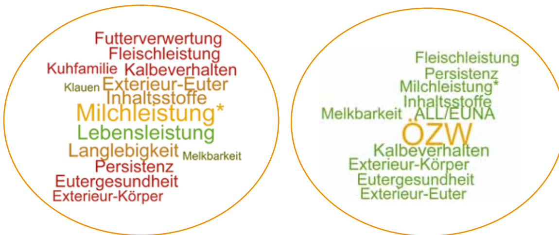
Abb.3 Genannte Auswahlkriterien für Deck- und KB-Bullen bei Auswahl nach Phänotyp (links) oder Zuchtwert (rechts) dargestellt als Wortwolken. Die Schriftgröße ist proportional zur Anzahl der Nennungen eines Kriteriums.

von Zuchtorganisationen weitere wichtige Auswahlkriterien. Aber auch Aspekte wie Preis, Verfügbarkeit, Behornung und Embryotransfer geben einen Hinweis auf bereits bestehende Probleme in der Zuchtpraxis einzelner Betriebe mit konventionellen Zuchtstrukturen, die solche Kriterien nicht berücksichtigen.